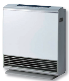
ガスファンヒーター